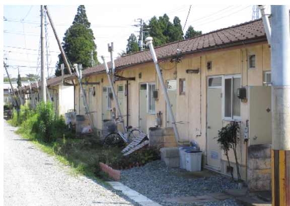
老朽化した市営住宅

備品の譲与は、退去者に喜ばれるが、退去後の空き室が利用できなくなるという問題もある。この時点でも希望地区への入居待機者がいるため、新たに入居する場合は、エアコンなどの備品を市の負担で再設置しなければならない。仮設住宅の空き室は、全国の市町から派遣された応援職員の宿泊に活用しているほか、今後、仮設住宅の集約先として活用する可能性があり、市は備品譲渡を慎重に検討したが、県が「譲渡可能」と先行発表したため、追随せざるを得なかった。