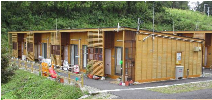
南三陸町が町営住宅化を検討する木造仮設住宅

住宅を建てるなど、同じ仮設住宅でも独自のアイデアを発揮した自治体もあった。仮設住宅の集約についても、多賀城市、岩手県釜石市が先行して計画を策定している。南三陸町は木造の仮設住宅5戸を町営住宅にリサイクル(費用は新築の8割。1棟5戸で3400万円)し、Uターン・Iターン政策に活用しようとしており、仮設住宅に恒久住宅の機能を持たせる新たな取り組みとして注目される(これからの対策として、震災直後はスピード重視で木杭を住宅基礎にしても、その後に基礎や防音工事をすれば恒久住宅にできるという仕組みを生み出せる可能性があるのだ)。これらの事例は、いずれも市町単独で仮設住宅を建設したことで、オリジナルな設計を可能にした。阪