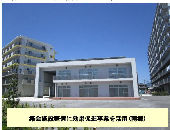
集会施設整備に効果促進事業を活用(南郷)

各自治体へ一括配分した効果促進事業費のうち計 2000 億円について使途がまだ決まっていないため、復興庁は効果促進事業を地域課題の解決へ活用した事例集を公表。利用見込みのある土地のかさ上げ、事業調整のためのコンサルタント活用、産業用地や観光交流施設の整備、被災宅地の土地利用計画作成と広場や交流施設の整備、震災遺構保存などの事例を紹介している。